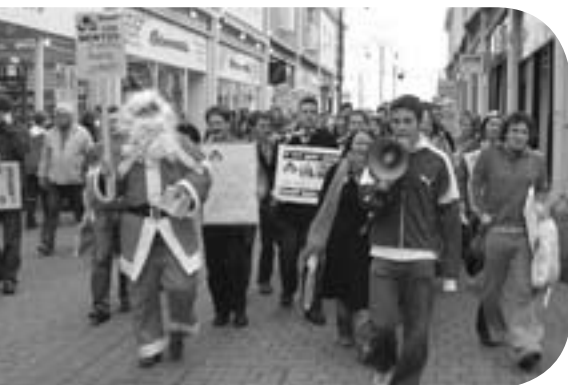
Trip siopa Nadolig yng Nghaerfyrddin: ar y stryd, meddiannu siopau, a gyrru cyfarchion nadolig i'r Cynulliad

Gan na lwyddwyd i gael gwasanaeth Cymraeg yn yr un o'r siopau cadwyn ar y daith drwy'r dre (er gwaethaf canu carolau swynol a Sion Corn llawen), penderfynwyd postio cerdyn at y Gweinidog Iaith yn y Cynulliad yn gofyn am Ddeddf Iaith newydd gynhwysfawr: Os y'n ni gyd yn blant bach da eleni, efallai cawn ni un yn anrheg arbennig iawn erbyn y Nadolig yma. Fel arall, gallwn ddechrau fod yn blant drwg iawn... ♪