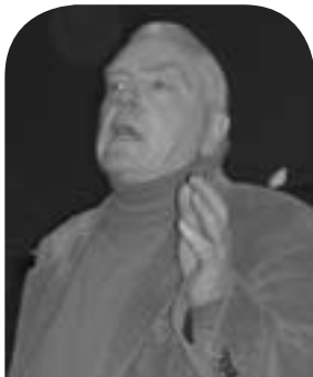
Chwith i'r Dde: Hywel Teifi, Alun Ffred a Leanne Wood

I'm proud to be part of this campaign that is as relevant in Penygraig as it is in Penygroes. It's been a long haul up til now, and there's more to come. But there is no question, we have to win it. The future of our language depends on it. ☺