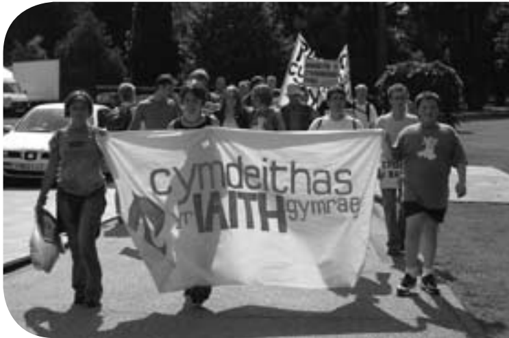
• Y cerddwyr yn cyrraedd swyddfeydd y llywodraeth yng Nghaerdydd

Mae yna rai camau penodol y dylid eu cymryd nawr: Dylid sicrhau cynnydd sylweddol yn yr arian a ddarperir ar gyfer y Cynllun Cymorth Prynu. Yn ogystal, dylid darparu digon o gyllid ar gyfer sefydlu'r 'Hawl i Rentu'. Byddai gweithredu yn y meysydd hyn yn gam cadarnhaol tuag at gyllido dyfodol i'n cymunedau. ☺