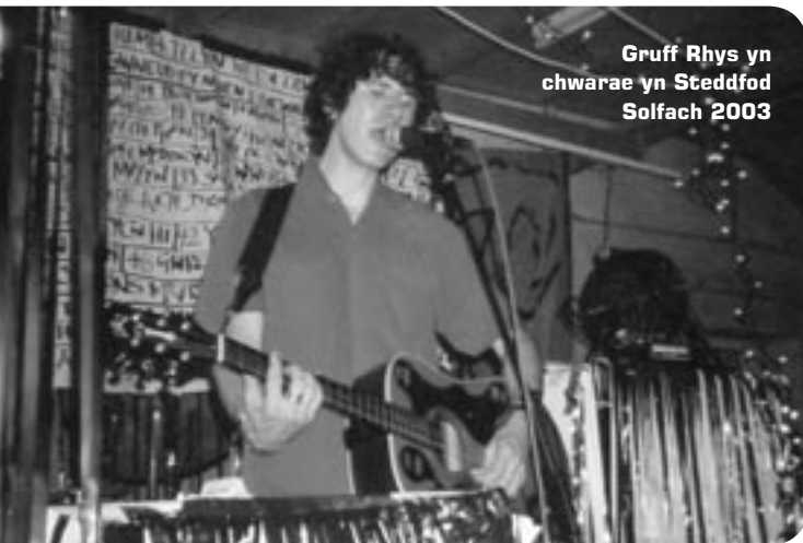
Gruff Rhys yn chwarae yn Steddfod Solfach 2003

O eddech chi'n un o'r rhai llwclus a lwyddodd i gael tocyn i un o gigs diweddar Gruff Rhys ac wedi'ch plesio gymaint nes eich bod ar bigau i'w weld eto?